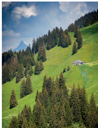
«Là-haut, sur la montagne, l'était un vieux chalet...»