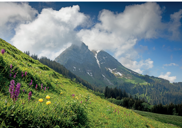
Le Moléson est la star incontestée de la région.

Auberge La Pierre à Catillon, Moléson-sur-Gruyères, 026 921 10 41, www.moleson.ch/auberge Restaurant-gîte de montagne Plan-Francey, 027 921 10 42, www.moleson.ch/pf