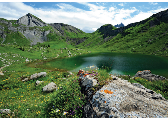
La région autour du Sulsseewli est considérée comme un lieu magique.

Taxi à Saxeten: 0800 55 23 60 Cabane du Lobhorn: 079 656 53 20, www.lobhornhuette.ch