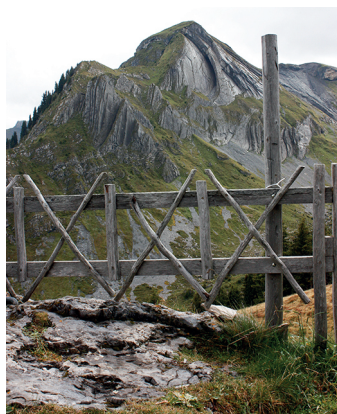
On distingue un cœur retourné dans le flanc de l'Ars.