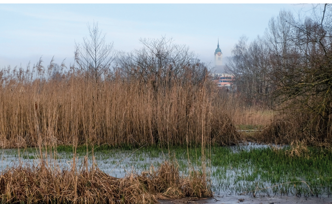
Le soleil hivernal fait briller d'une couleur dorée la ceinture de roseaux du lac de Hallwil.

Camping Seeblick Mosen, 041 917 16 66, www.camping-seeblick.ch