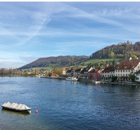
Un plongeon dans le Rhin à Stein am Rhein offre un rafraîchissement bienvenu.

On accède à Ramsen, Petersburg en bus depuis Schaffhouse ou Singen