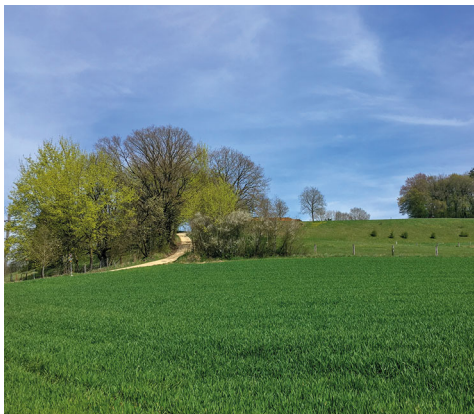
aysage bucolique près de Ramsen.