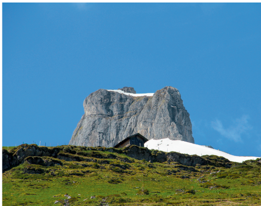
A gauche: vue à travers la gorge de Gamchi sur le Morgenhorn (à g.) et la Wildi Frau (à d.). A droite: l'imposant Bundstock.