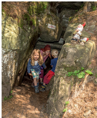
A gauche: la passerelle en bois de la réserve forestière du Gägger, autrefois détruite par Lothar. A droite: visite de la caverne des nains, le Cheeserenloch.