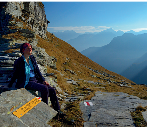
La randonnée mène en altitude au milieu d'un paysage de rêve.

Cabane autosuffisante Capanna Efra (réservation conseillée), 079 256 56 69, www.verzasca.net/capanna.php