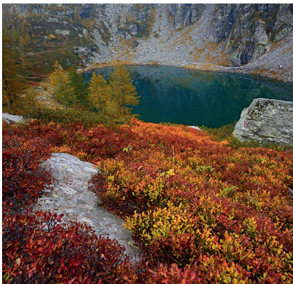
Le Lago d'Efra, isolé, aux pieds de la cabane du même nom.