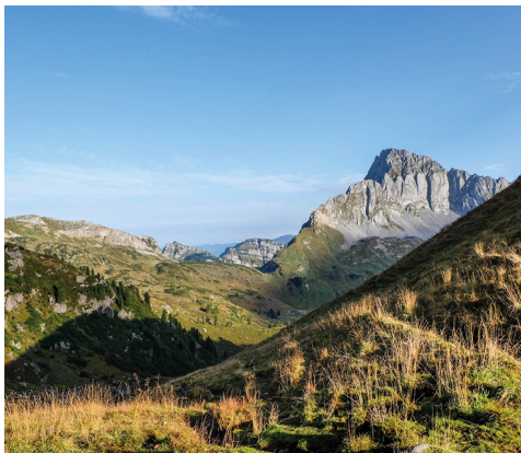
Le Mürtschenstock, qu'on découvre pour la première fois depuis le col du Murgseefurggel.