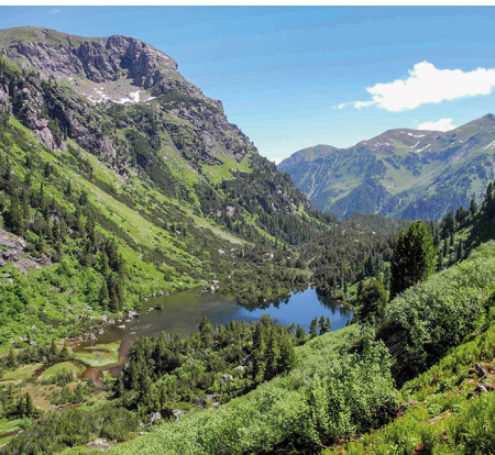
Vue sur le lac d'Unterer Murgsee, la plaine alluviale et la forêt d'aroles.

On accède à l'alpage de Mornen depuis Murg avec le bus Walser 079 406 34 22 (réservation nécessaire).