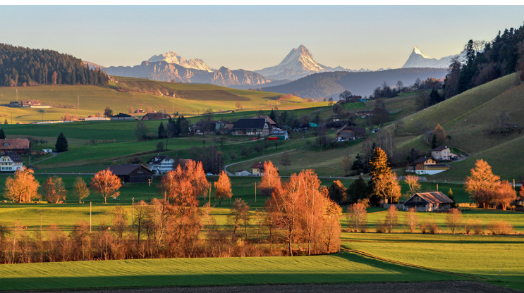
Superbe vue sur les Hautes-Alpes bernoises: le Wetterhorn, le Schreckhorn et le Finsteraarhorn.

Restaurant Rütthubelbad, 031 700 81 81, www.ruethubelbad.ch