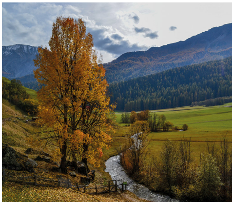
Les berges du Rom près de Fuldera.