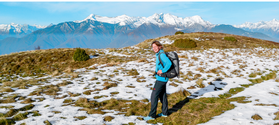
Sur la Cima di Medeglia, la première neige a déjà presque fondu. Au Pizzo di Vogorno et à la Cima dell'Uomo, au second plan, l'hiver a fait son apparition.

Osteria Canedo, 091 946 13 90, https://osteria-canedo.business.site