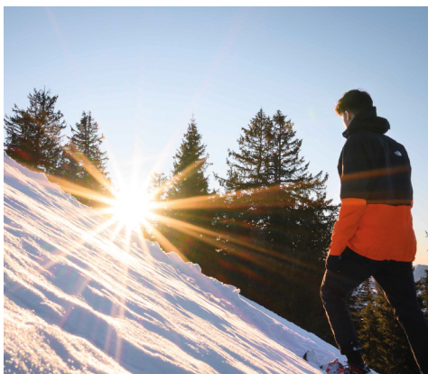
Un autre bois charmant, peu avant la montée escarpée vers Hochalp.