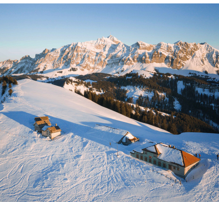
Hochalp jouit d'une situation exceptionnelle. Au fond, le Säntis.

Auberge Hochalp, se renseigner sur les horaires d'hiver au 071 364 11 15 / 071 364 15 86