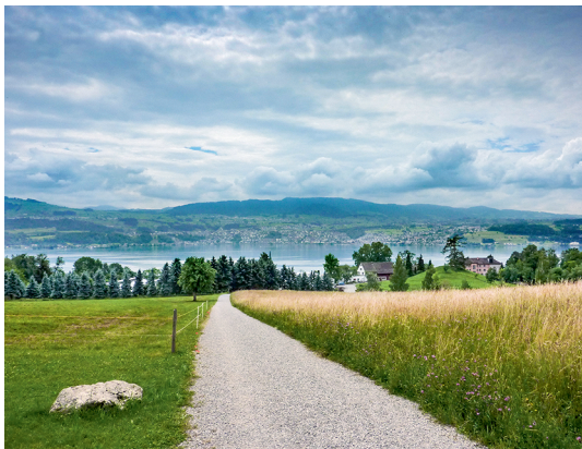
Entre deux auberges au-dessus de Stäfa. La randonnée emprunte souvent des chemins ruraux.