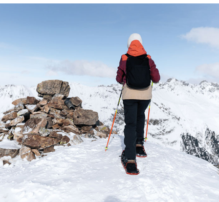
On y est: arrivée au sommet du Piz Darlux.

On accède à Alp Darlux en télésiège depuis Bergün. Il faut compter environ 20 minutes de marche entre la gare de Bergün et le télésiège. Bergün Filisur Tourismus, 081 407 11 52, berguen-filisur.graubuenden.ch/de Restaurant La Diala, 081 407 12 55, www.ladiala.ch