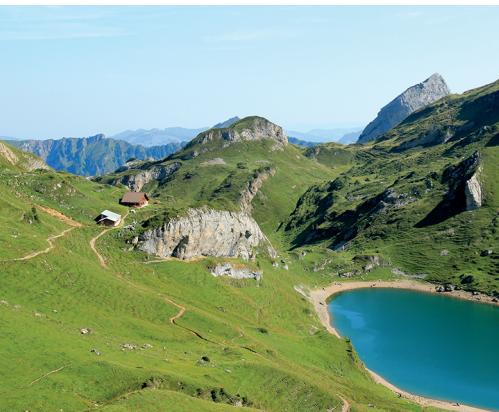
Se restaurer sur l'alpe Spilau et se rafraîchir dans le petit lac.

Bus pour Riemenstalden (Käppeliberg): réservation obligatoire par téléphone. 041 820 32 55 ou 079 249 47 02, www.riemenstalden.com . Alpe Spilau, 079 567 45 64, www.alp-spilau.ch Restaurant d'altitude Oberaxen, 041 870 93 12, www.oberaxen.ch