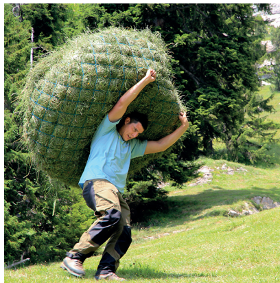
Sur le Wildheuerpfad, un paysan transporte un lourd filet de foin.