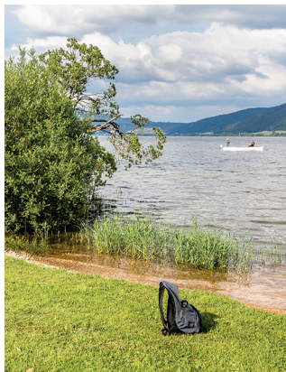
Après l'effort, le réconfort d'une trempette dans le lac de Joux.