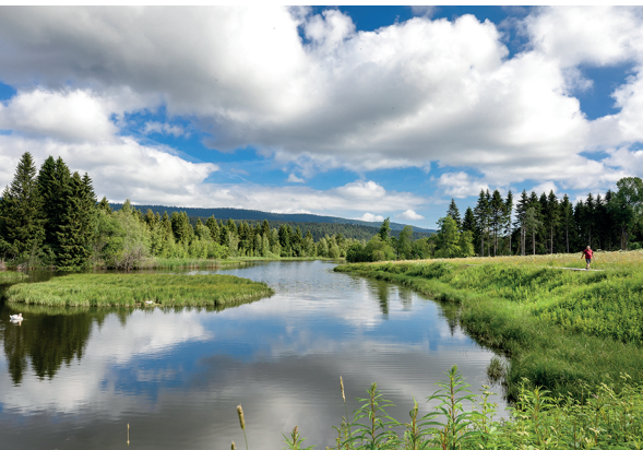
Idylle naturelle près de Tête du Lac.

Camping à la Ferme, 021 845 54 04, 021 845 48 15, www.campinglesbioux.ch Altitude 1004, 079 282 98 52 et 078 686 20 33, www.altitude1004.ch Hôtel-Restaurant Bellevue Le Rocheray, 021 845 57 20, www.rocheray.ch