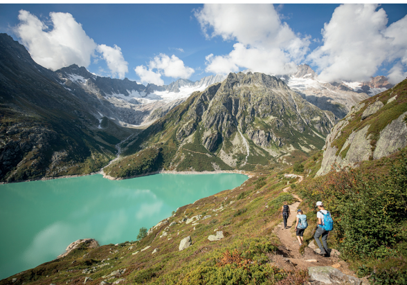
Vue spectaculaire : derrière le lac de Göscheneralp se présente la chaîne du Dammastock.