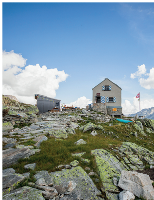
La Dammahütte est l'une des plus petites cabanes gardées du CAS.