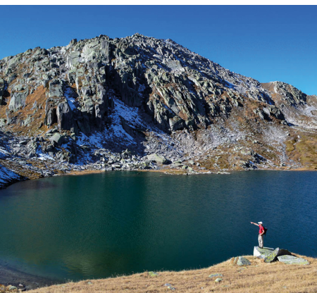
Un des lacs cristallins parmi les Laghi della Valletta.

On accède au sommet du col du Gothard en bus depuis la gare d'Andermatt ou d'Airolo. Retour depuis la gare de Realp.