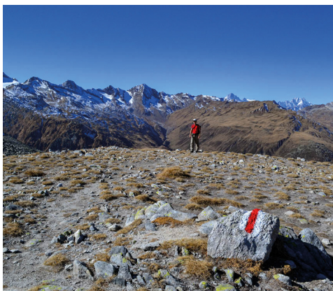
Le versant uronais du Gatscholalücke.