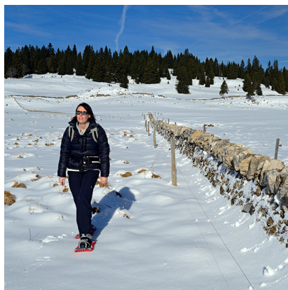
De vastes prairies jurassiennes et leurs murs en pierres sèches.