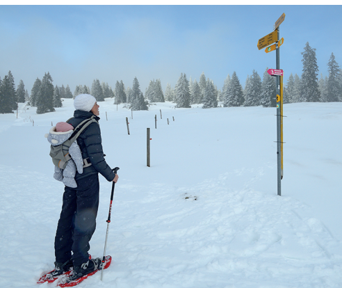
Aux Monts de Bière Derrière, on quitte la crête.

Hôtel du Marchairuz, 021 845 25 30, www.hotel-marchairuz.ch