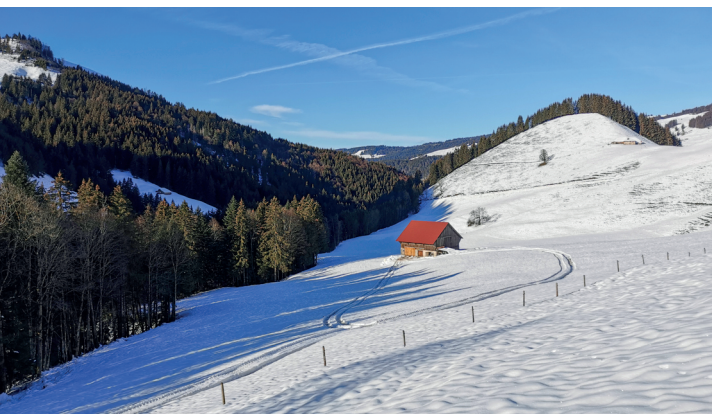
Pâturage enneigé à La Scie.

Télécharmey, 026 927 55 20, www.charmey.ch