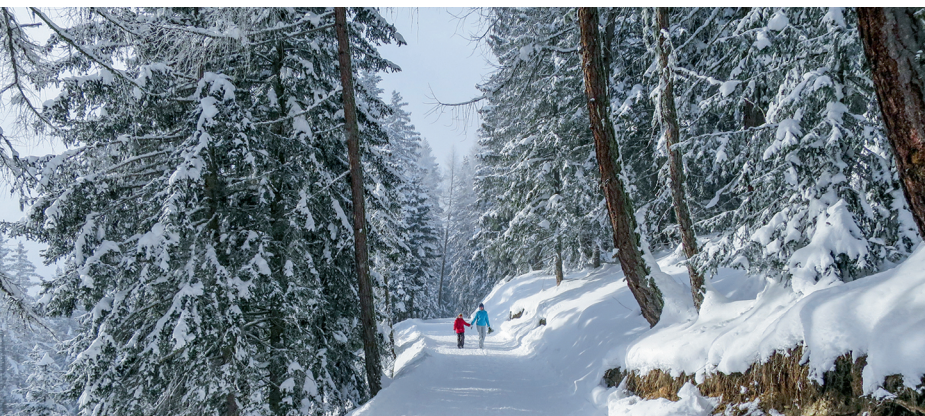
Forêt hivernale féerique près de Vermala.

CMA SA, 0848 22 10 12, www.crans-montana-aminona.com Cave de Colombire, 079 220 35 94, www.colombire.ch