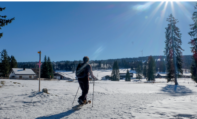
Vastes étendues, soleil et vent, le trio typique de la randonnée en raquettes dans les Franches-Montagnes.

On accède aux Breuleux en train depuis La Chaux-de-Fonds ou Bienne, en changeant à Tavannes. Aux Délices, boulangerie et café, 032 954 14 01 Hôtel de la Balance, 032 954 14 13, www.hotelbalance.ch Buvette du télésiège Les Breuleux SA, 032 954 16 21 www.telebreuleux.ch