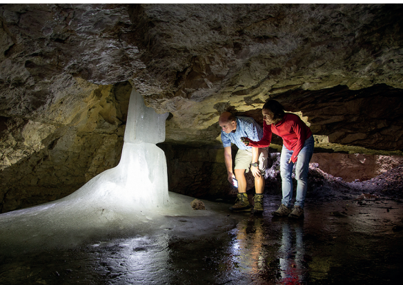
Grâce aux particules recouvrant la glace, les crampons ne sont pas indispensables.

Possibilité de faire du feu aux abords de la glacière de Monlési.