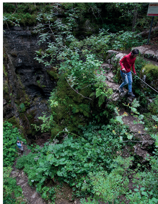
A chaque pas franchi en direction de la grotte, la température baisse d'un cran.