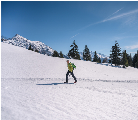
Un paysage enneigé féérique.