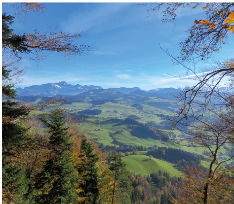
Vue sur le massif du Säntis depuis le Gerensattel.