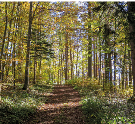
La forêt automnale au-dessus d'Ebersol.

L'auberge d'alpage de Wimpfel se trouve à environ 350 mètres ou douze minutes de marche de la crête du Gerensattel, 079 224 01 68, www.alp-wimpfel.ch (Elle est ouverte les week-ends toute l'année.)