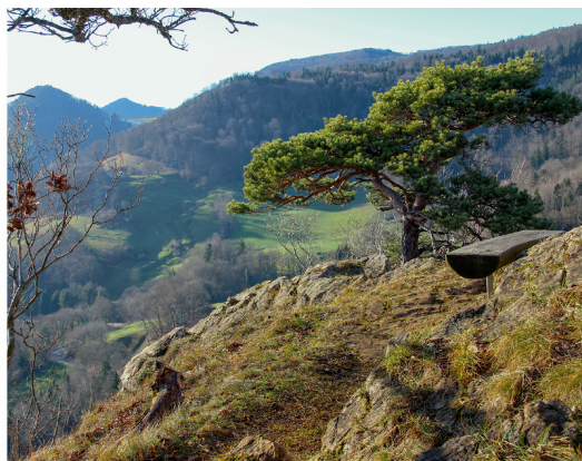
A gauche: la Ramsflue en hiver, mais sans manteau neigeux. A droite: vue sur la Geissflue.