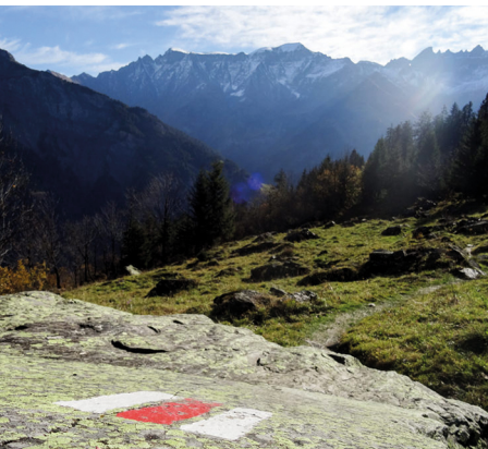
Le sublime panorama se dévoile un peu plus à chaque étape de l'ascension.

On accède à la station d'Empächli en téléphérique depuis Elm.