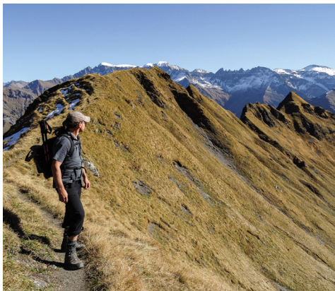
Peu après le point culminant de la randonnée de montagne.