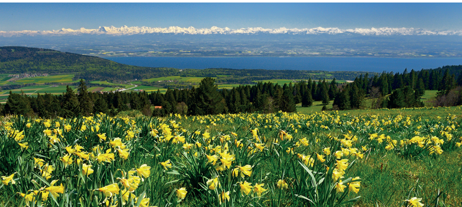
En mai, le printemps règne dans le Jura mais les Alpes sont encore largement enneigées.

Hôtel-Restaurant de la Vue-des-Alpes, 032 854 20 20, http://vue-des-alpes.ch