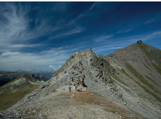
En haut, au col de la Forcletta: c'est au même temps la frontière linguistique.

Hôtel Schwarzhorn à Gruben, 027 932 14 14, www.hotelschwarzhorn.ch Hôtel Weisshorn, 027 475 11 06, www.weisshorn.ch