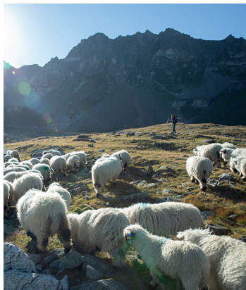
Dans la vallée d'Äugsttälli, on rencontre des moutons à nez noir.