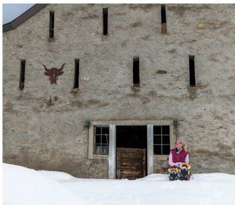
On profite du soleil d'hiver, adossé au mur de la maison, en grignotant un snack.