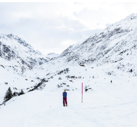
La vaste vallée offre détente et grandes bouffées d'air frais.

Il y a environ cinq minutes à pied entre la gare et le départ de la randonnée. On peut aussi prendre le bus, qui part toutes les demi-heures, jusqu'à l'arrêt «Brücke». Le temps de route est toutefois plus long (15 minutes).