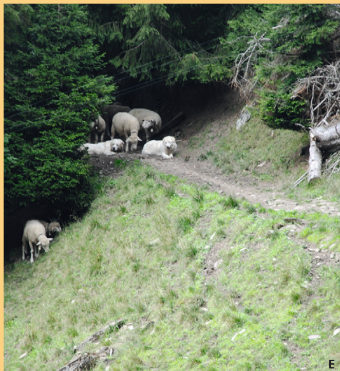
De telles situations augmentent le risque d'incidents entre CPT et randonneurs et doivent être identifiées. Les troupeaux et les chiens doivent être tenus à l'écart de chemins officiels de randonnée, en particulier dans les secteurs étroits et pendant la haute saison de randonnée.