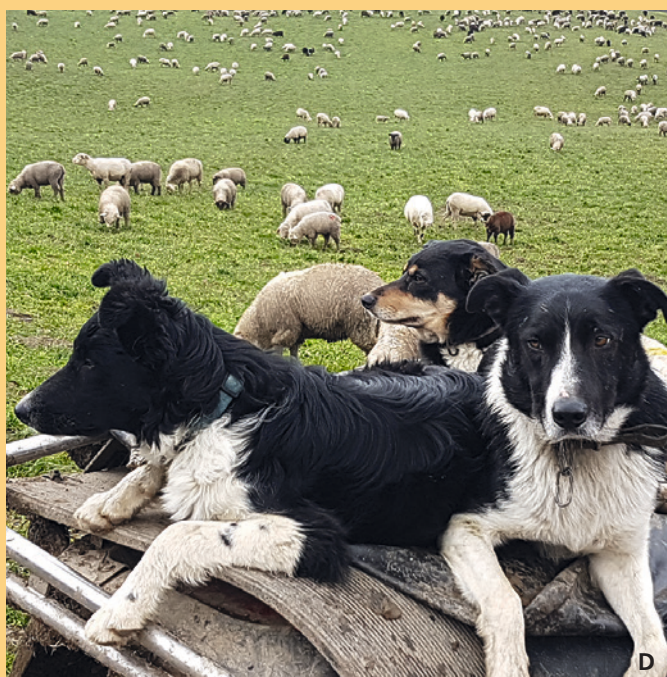
Les chiens de bergers et les chiens de ferme doivent à tout moment être maîtrisés par leurs maîtres.

Des facteurs externes comme l'heure du jour, la météo, la présence de prédateurs, etc. influencent l'attention et la réactivité des CPT; les maîtres des chiens ou les tierces personnes n'ont aucune influence là-dessus. Outre ces facteurs externes, le comportement du vis-à-vis (randonneur, chien de compagnie, etc.) lors d'une rencontre avec des CPT a une grande influence sur la façon dont se déroule cette interaction.