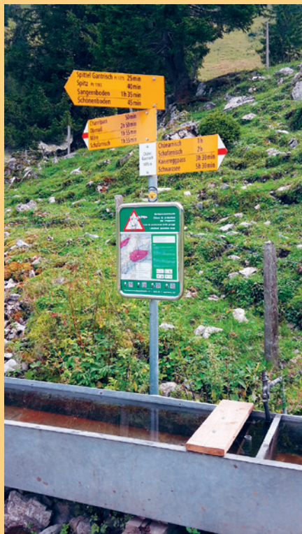
Wird beabsichtigt, Tafeln an Pfosten offizieller Wanderwege zu montieren, so ist dies zwingend mit dem zuständigen Wanderwegverantwortlichen abzusprechen.

Die Markierungstafeln gibt es in einer metallenen Standardausführung (links, 36 × 59 cm) sowie in einer kleineren leichten Plastikausführung (rechts, 15 × 30 cm). Die einfach zu transportierenden Plastiktafeln können dort verwendet werden, wo sie nur kurzzeitig benötigt werden sowie zur Information an Orten von untergeordneter Bedeutung.