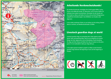
Exemple d'une feuille plastifiée simple destinée à un petit panneau d'information (lieu : Alp Flix GR).