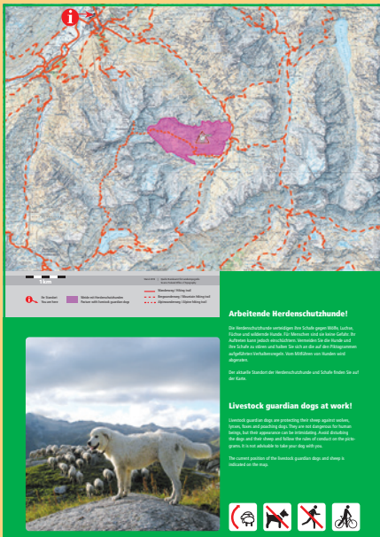
Exemple d'une feuille plastifiée double destinée à un grand panneau d'information (lieu : Andermatt UR).

Les panneaux sont disponibles gratuitement auprès d'AGRIDEA. Pour l'élaboration des panneaux les indications suivantes sont nécessaires :