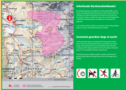
Beispiel eines einteiligen Tafeleneinschubs für die kleine Basistafel (Standort Alp Flix GR).