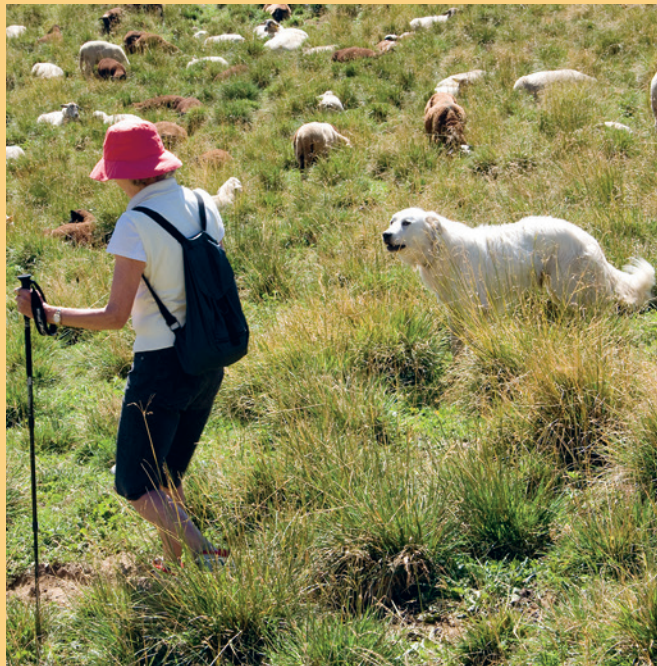
Viele Wandernde wissen nicht, wie sie sich bei Begegnungen mit arbeitenden Herdenschutzhund korrekt verhalten sollten.