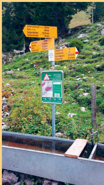
Si l'intention est de monter les panneaux sur les poteaux de chemins de randonnée officiels, il faut en référer impérativement au responsable des chemins de randonnée.

Les panneaux de signalisation existent dans une version standard en métal (à gauche 36 × 59 cm) et dans une version, en plastique, plus petite et plus légère (à droite, 15 × 30 cm). Les panneaux en plastique peuvent aisément être transportés et sont donc pratique pour les pâturages utilisés durant une courte période ou ceux faiblement fréquentés.