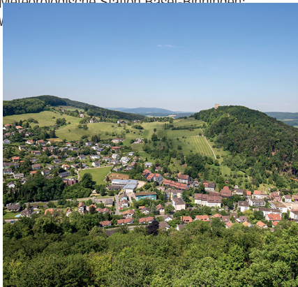
Die Wanderung bietet weite Blicke auf das Leimental.