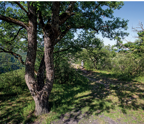
Das Klima ist mild auf dem Chöpfli. Deswegen gefällt es der Flaumeiche hier.

Meteorologische Station Basel-Binningen: