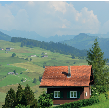
Blick zurück von Hemberg zum Hinterfallenchopf.

Restaurant Sternen in Bendel, 071 993 17 02