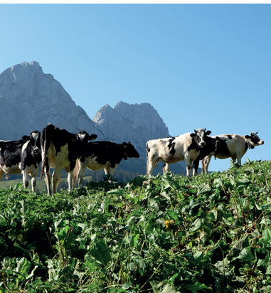
Freiburger Kühe vor den Gastlosen.

Mehrere Restaurants und Hotels in Jaun oder Charmey