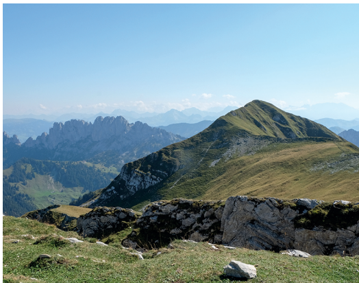
Der Cheval Blanc, einer der zwei Gipfel der Hochmatt.