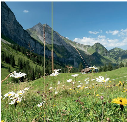
Die Wanderung führt über die Oberbauenalp zum Rinderbüel.