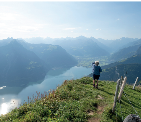
Vom Weg aus geniesst man den Blick auf den Urnersee Richtung Uri.

Berggasthaus Niederbauen, 041 620 23 63, www.berggasthaus-niederbauen.ch Alpbeizli Tritt, 079 579 27 60, www.worldofcheese.ch/alp-tritt Berggasthaus Stockhütte, 041 620 53 63, www.stockhuette.ch