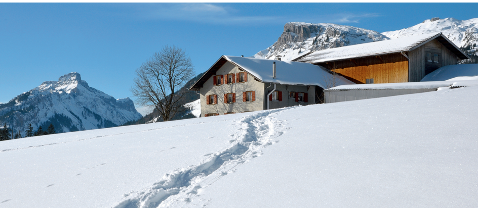
Der Bauernhof Salwideli liegt wunderschön auf einem sonnigen Rücken und bietet Zimmer im Sommer und Winter an.

Bauernhof: www.bauernhof-salwideli.ch , Schlafen im Stroh, Zimmer, 200 Meter vom Weg Sörenberg Fühli Tourismus, www.soerenberg.ch Schangnau Tourismus, www.tourismus-schangnau.ch