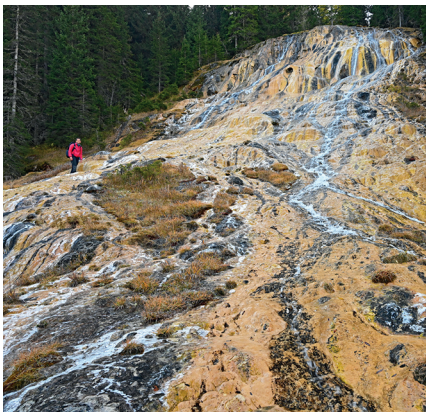
Die Fontaines Jaunes sind riesig.