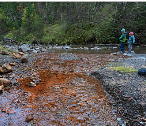
Das rote Wasser vermischt sich mit dem klaren der Vièze.

Restaurant d'Alpage Cantine de They, 024 477 48 45