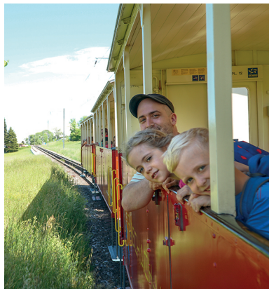
Zur Belohnung dürfen die Kinder ein Stück mit der Zahnradbahn fahren.