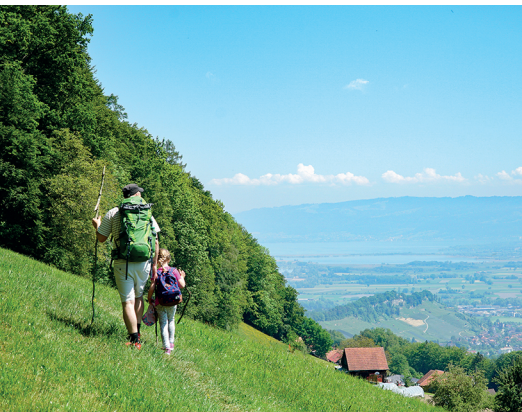
Tolle Aussicht auf den Bodensee.

Gasthaus zur Fernsicht Heiden, 071 898 40 40, www.fernsicht-heiden.ch Schloss Wartensee, 071 858 73 73, www.wartensee.ch