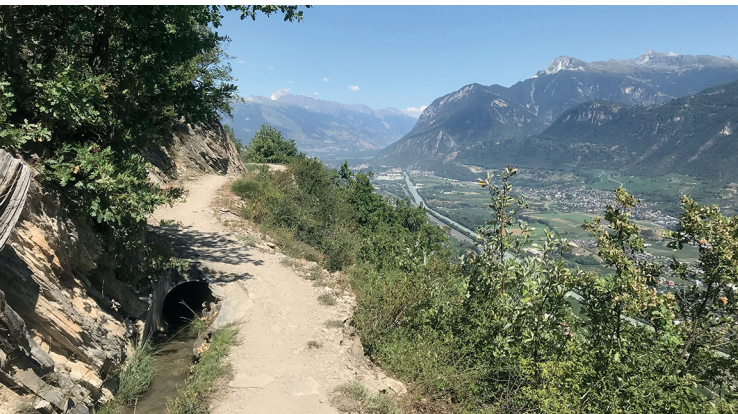
Dopo il belvedere la veduta si apre sulla valle del Rodano verso l'Alto Vallese.

Bistro d'Icogne, 079 266 09 34, www.bistro-icogne.ch/ Le Relais Fleuri, Chermignon-d'en-Bas, 027 565 74 12, www.relais-fleuri.ch