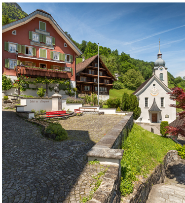
Bauen ist erreicht, nun kommt mit der Schifffahrt der krönende Abschluss.