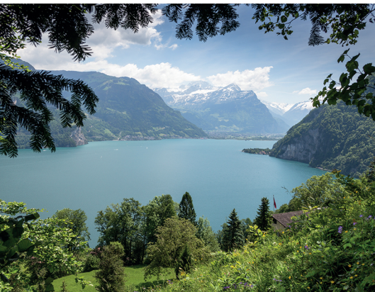
Immer Richtung Süden, dem Urnersee entlang. Hinten der Bristen im Reusstal.

Sommerrestaurant Schiffländi, Bauen (offen, wenn Jolanda da ist)