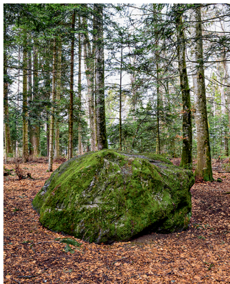
Ein vom Rhonegletscher in die Genferseeregion verfrachteter Findling.