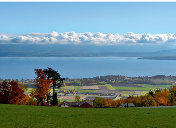
Blick über den Genfersee zum französischen Ufer.