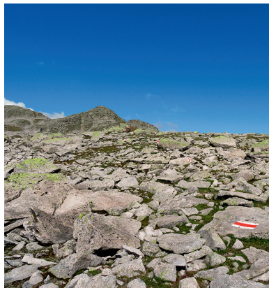
Suchbild: wie viele Bergwanderweg - Markierungen sind auf dem Foto?