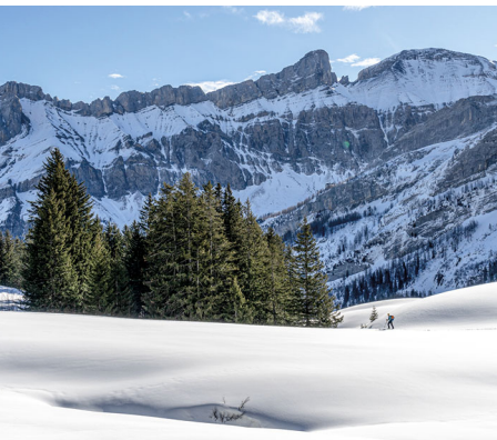
Kleiner Schneeschuhwanderer vor grossen, schattigen Felswänden.

Restaurant du Pillon: Tel. 024 492 10 00, www.col-du-pillon.ch