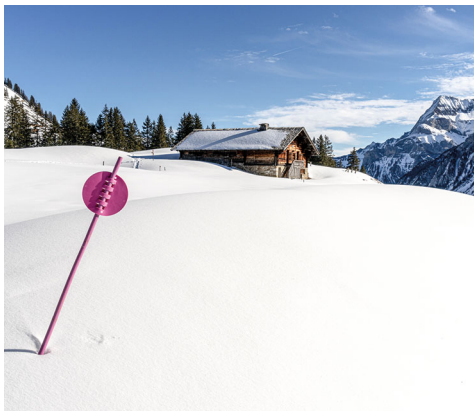
Die Alphütte von Le Rard mit dem Spitzhorn im Hintergrund.