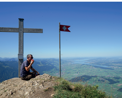
Ganz oben auf dem Federispitz, mit Blick auf den Zürichsee.

Café Löwen, Amden, 055 611 11 18, www.baecerei-wick.ch Parkcafé Kreuzstift, Schänis, 055 619 38 11, www.kreuzstift.ch