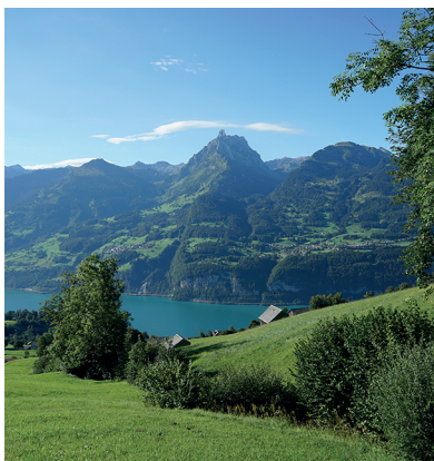
Der Walensee und der Mürtschenstock von Amden aus gesehen.