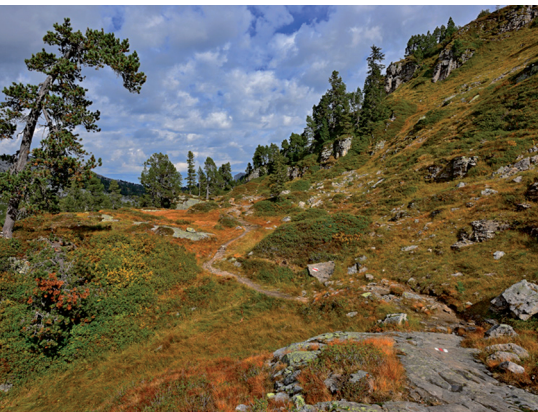
Im Seefeld treiben sich nicht immer nur Menschen herum.