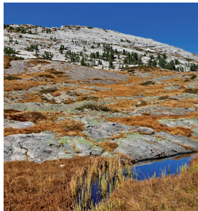
Riesige Karrenfelder, dahinter die Sibe Hängste: Das Seefeld bietet malerische Szenen.