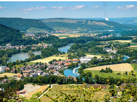
Vom Gebenstorfer Horn aus sind die Zusammenflüsse von Aare, Limmat und Reuss zu sehen.

Restaurants und Hotels in Brugg, Windisch, Birnenstorf und Turgi