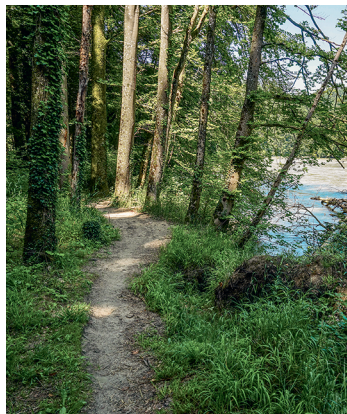
Am wilden Ufer der Reuss.