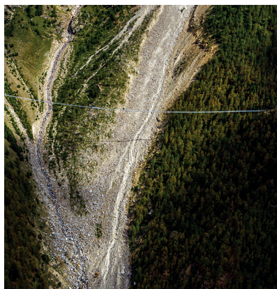
Unten ist der Berg in Bewegung - die neue Brücke ist jetzt viel besser geschützt.