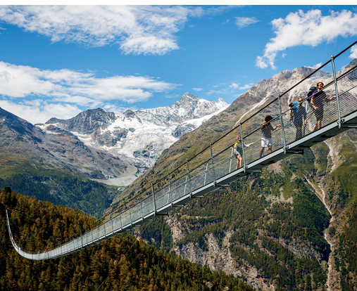
Die Brücke lockt Wanderer aus der ganzen Welt an.

Europahütte (Juni bis September), 027 967 82 47, www.randa.ch/huetten Weitere Restaurants und Hotels in Randa