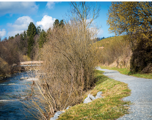
Die Holzbrücke ist der Höhepunkt des neuen Rundwegs.

Grosse Auswahl an Cafés und Restaurants in Appenzell, www.appenzell.ch/gastronomie