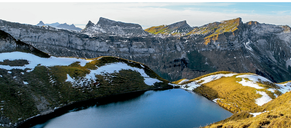
Ürtümliche Berglandschaft am Sihlseei, Pfannenstöckli, Schülberg, Fidisberg, Biet (v.l.n.r.).

Alpen-Taxi Pragel-Garage, Muotathal, 041 830 11 81